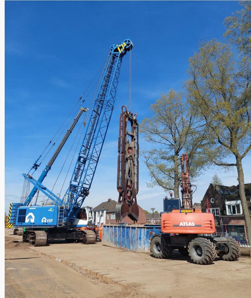
Aanleg trillingswerende ondergrondse constructies Vught-Noord