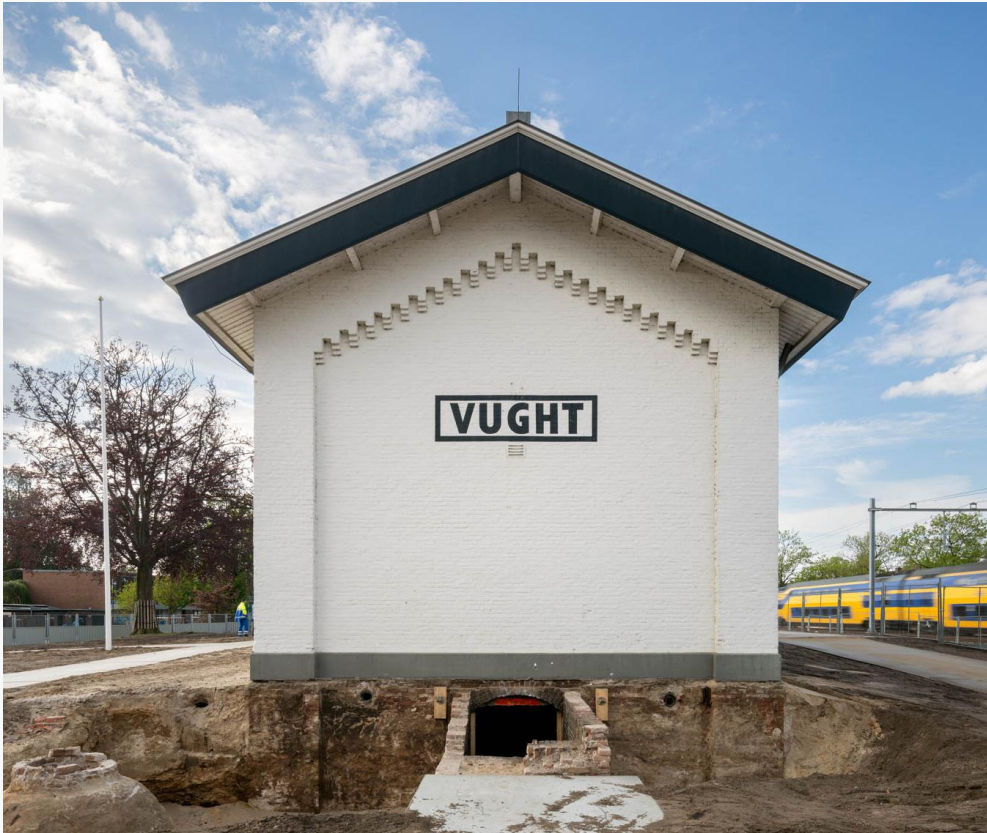
Vorbereidingen verplaatsen stationsgebouw