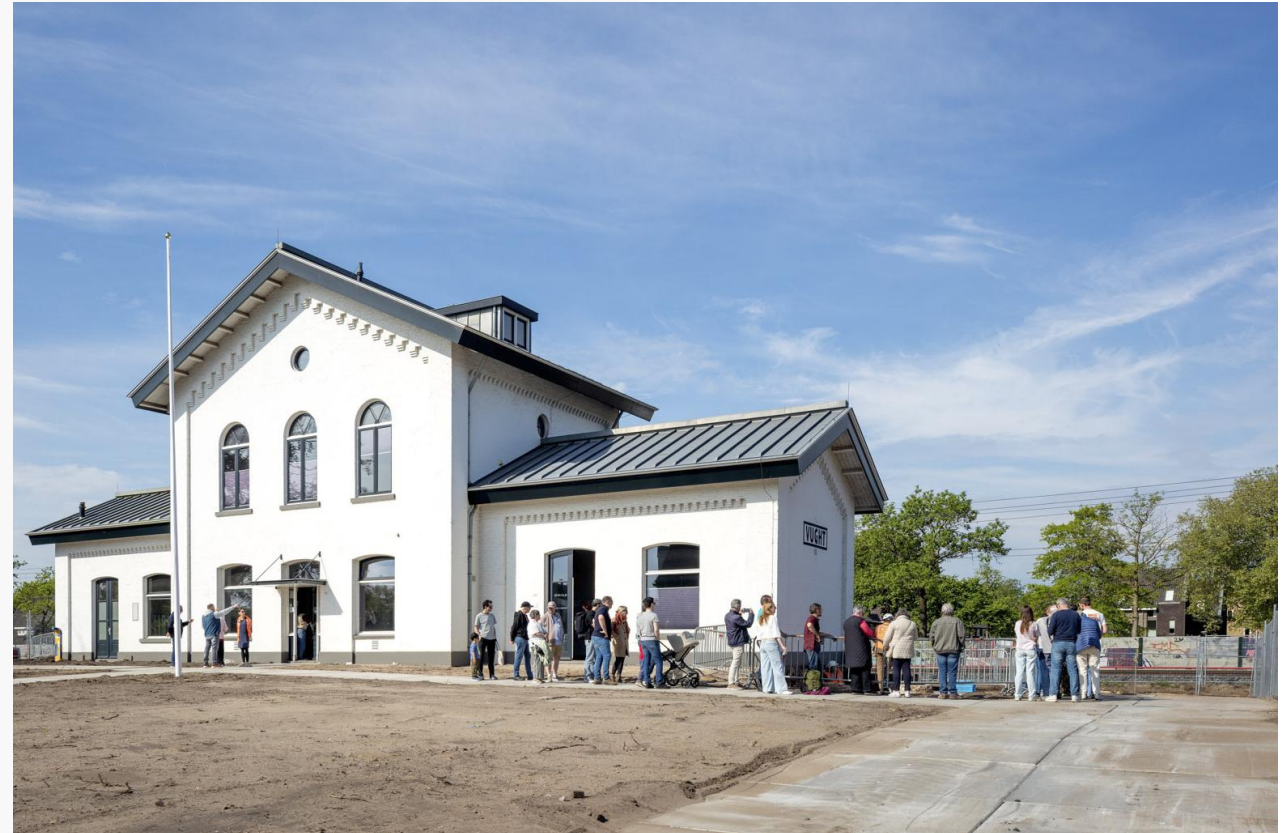
Openstelling kelders t.b.v. herdenking op 2 en 4 mei