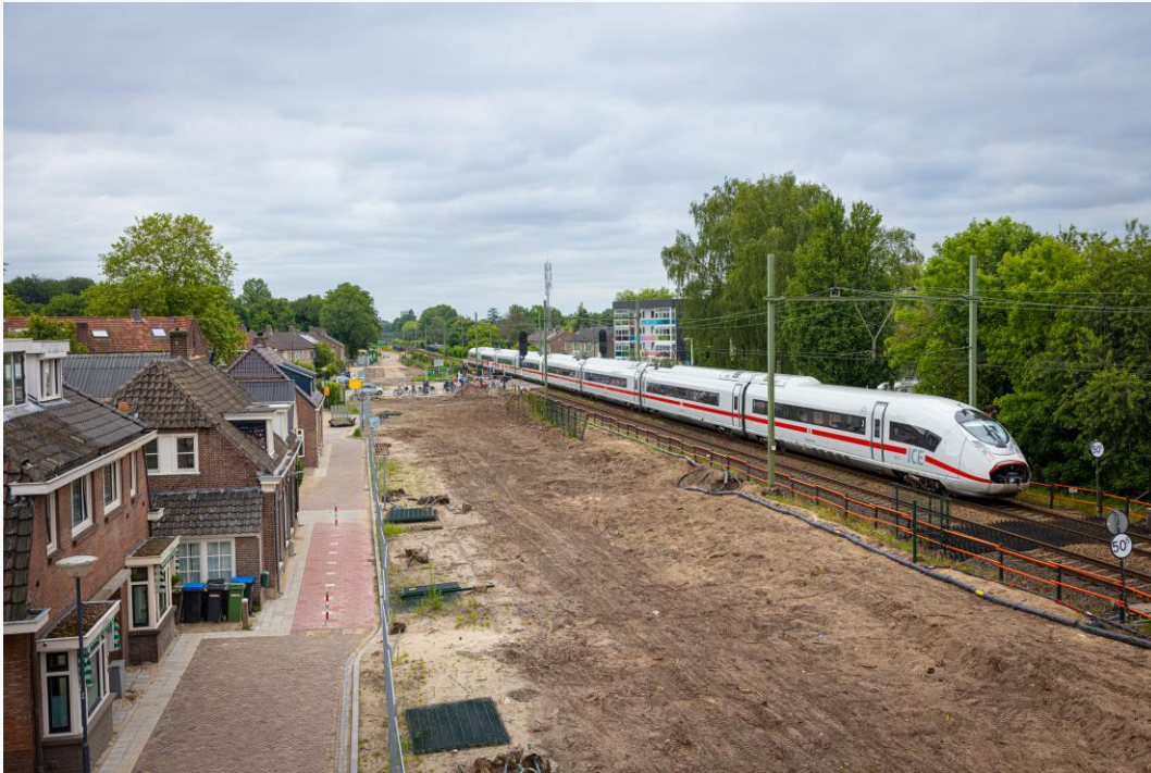
Aanleg van het tijdelijk spoor