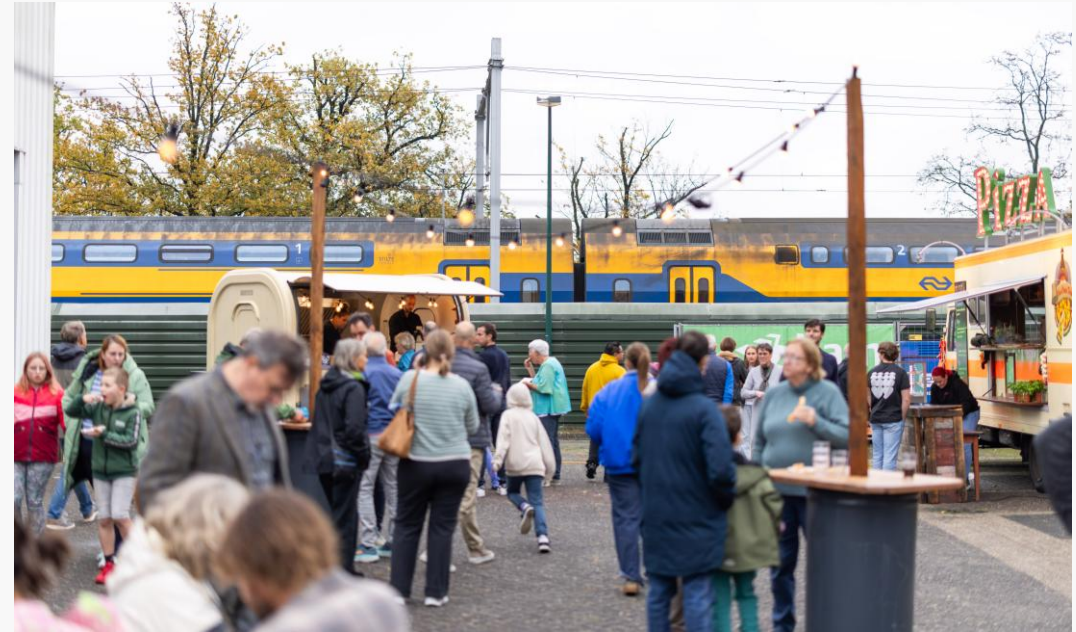
Feestelijke opening met de omgeving bij Novalis