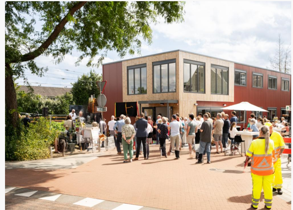
Opening van het informatiecentrum