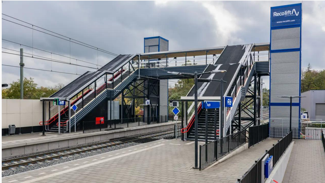
Indienststelling van de tijdelijke sporen en station