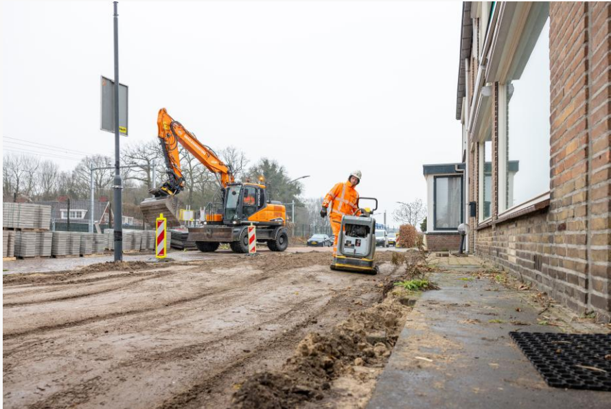
Aanleg tijdelijke weg Rembrandlaan