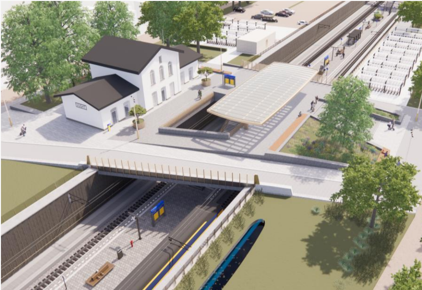
Verdiepte ligging met nieuw station